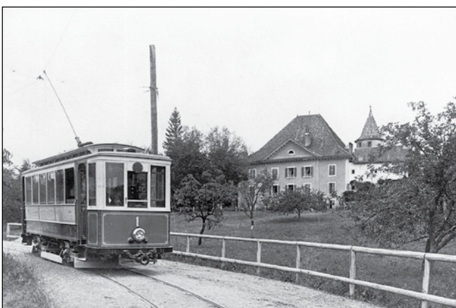
Gland – Begnins (GB): Un jour de 1910, la motrice Ce 2/2 1 quitte Begnins en direction de Gland et passe devant le château du Martheyay..

Pas moins de douze pages sont consacrées à une pittoresque ligne de tramway vicinale de la Côte vaudoise, disparue voici bientôt 60 ans. De nombreuses images et des témoignages font revivre avec émotion, l'instant d'une lecture, cette intéressante infrastructure de transport qui reliait jadis Gland à Begnins.