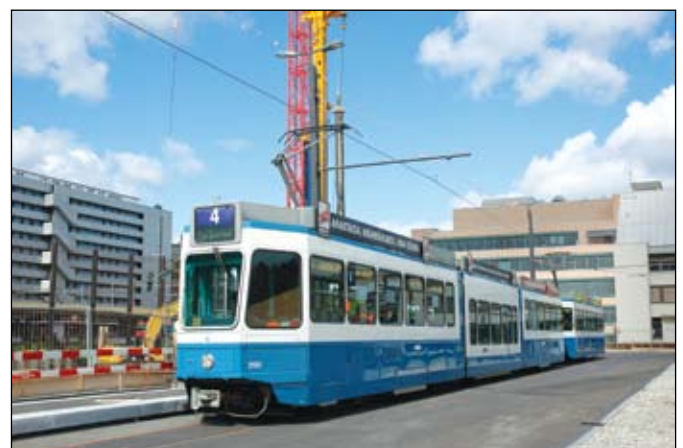
Zurich (VBZ): La rame Be 4/6 2120 + Be 2/4 2435 effectue une course d'essais sur la nouvelle ligne de l'ouest zurichois et fait arrêt dans la boucle du terminus de la gare d'Altstetten, le 18 juillet 2011. Photo extraite de Tram n° 108, page 5.

Prise de vue: Archives BCU; collection Commune de Gland