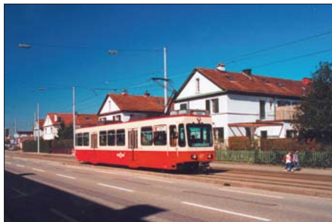
Zurich (FB): L'automotrice Be 4/4 57 du Chemin de fer de Forch (FB) a été photographiée sur le réseau urbain des tramways zurichois, devant les maisons Bernoulli, à l'occasion d'une course spéciale organisée par l'association Aktion Pro Sächsitram le 1 er avril 2001.