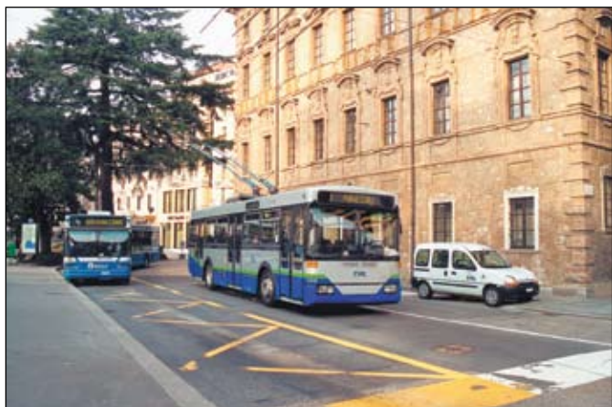
Lugano (TPL): Le trolleybus 208 des transports publics de Lugano revêt la nouvelle identité visuelle de la compagnie alors que cette dernière a décidé de supprimer définitivement ce mode de transport à l'été 2001. L'image date du 3 février 2001 et a été prise à la Piazza Manzoni. Photo extraite de Tram n° 66, page 22. Prise de vue: Matthias Lemans

Le magazine est complété par de nombreuses actualités. Vous découvrez, en images et en textes, les nouveautés de l'horaire de l'été 2001, telles que le Fun'Ambule à Neuchâtel, Constellation à Genève, le nouveau concept de desserte de Köniz près de Berne, et bien d'autres curiosités encore.