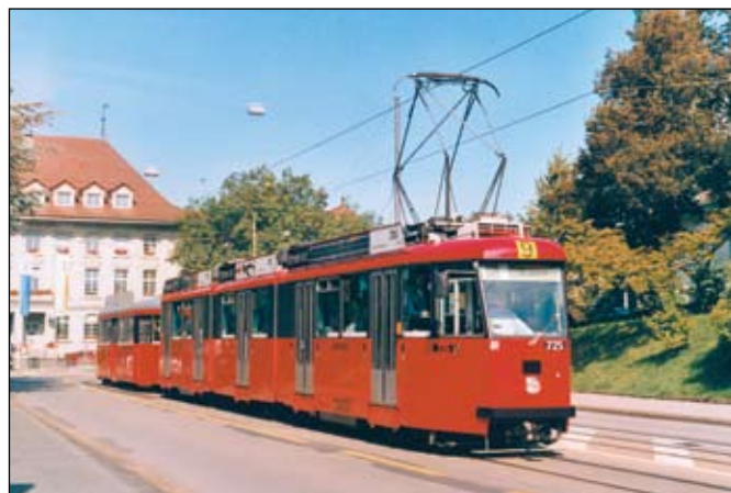
Berne (SVB): Alors qu'à Genève on construit de nouvelles lignes de tramways, la ville de Berne préfère investir dans l'aspect de ses véhicules. Même les remorques normalisées de 1951 «rougissent», comme sur cette photographie de la B 322 tirée par la Be 8/8 725 sur la rue de la Grenette le 27 septembre 2002.