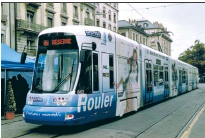
Genève (TPG): Le baptême de la nouvelle motrice Cityrunner (Flexity Outlook) Be 6/8 862 aux effigies d'Unireso et du TCS a eu lieu à Rive le 6 octobre 2004. Photo extraite de Tram n° 80, page 65.

L'actualité de la fin de l'année 2004 est également marquée par les préparatifs de la mise en service de la première étape de Rail 2000 avec ses nombreuses répercussions sur les transports publics dans les principales agglomérations du pays. Les RER sont particulièrement concernés par ces mesures, à l'instar du réseau de Berne où un nombre important de chantiers d'envergure aboutiront quasiment simultanément. A Genève, le changement d'horaire apporte une fois de plus son lot d'adaptations dans l'offre des transports publics.