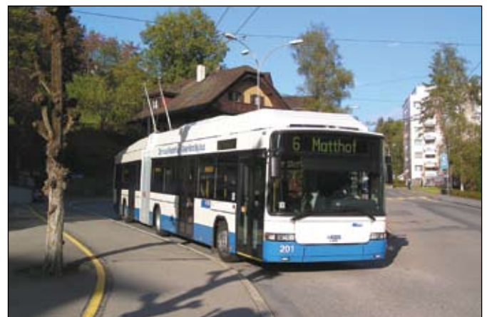
Lucerne (VBL): La première course commerciale du nouveau trolleybus articulé 201 s'est déroulée le 22 octobre 2004 sur la ligne 6. L'image montre le véhicule au terminus de Würzenbach.