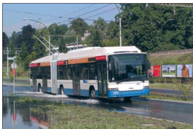
Lucerne (VBL): Lorsque le 29 août 2005 le quai du Schweizerhof a rouvert après la décrue du lac des Quatre-Cantons, des trolleybus standard ont pu circuler sur les lignes 6/8 jusqu'au Musée des transports. Vers 9 heures la ligne 2 a pu être rétablie jusqu'à Würzenbach, permettant le retour des trolleybus articulés comme en témoigne cette image du véhicule 202.